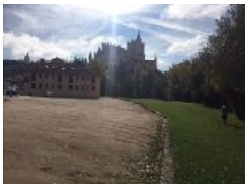
FOTO OFICIAL EN SEGOVIA

En la Ruta-excursión libre a Segovia, con aperitivo y foto con fondo al Alcázar el sábado 13 a las 17:00 c/ San Marcos 20. GPS 40°57'17" N 4°8'3" O